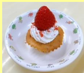
苺のカップケーキ